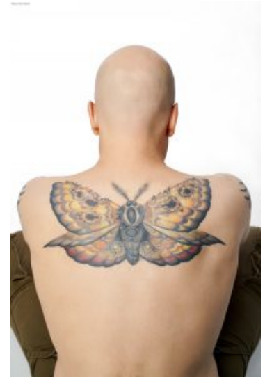
Devin Townsend – The Moth (InsideOut Music/Sony Music, 29.05.2026)