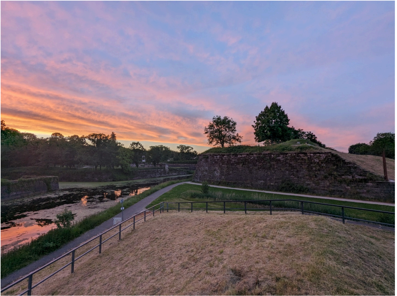
Blick vom Ravelin V der Festung Saarlouis