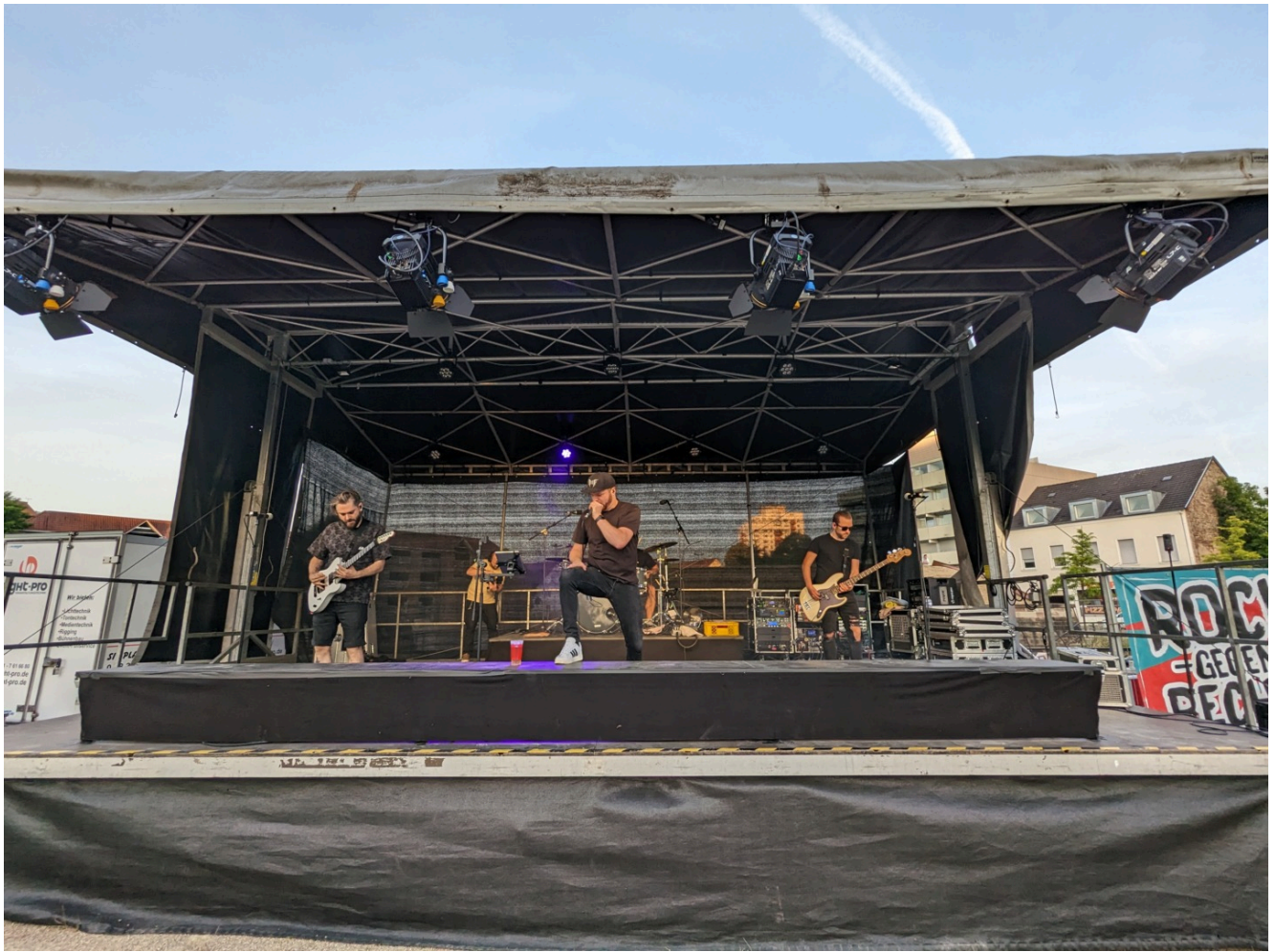
Post Hardcore aus Bremen.