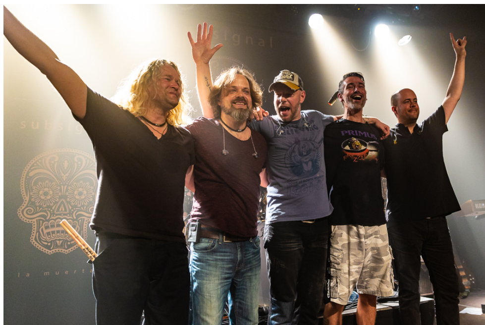
Subsignal (Foto: Andrew Ilms; übrigens auch bei den Illustrationen des Albums)