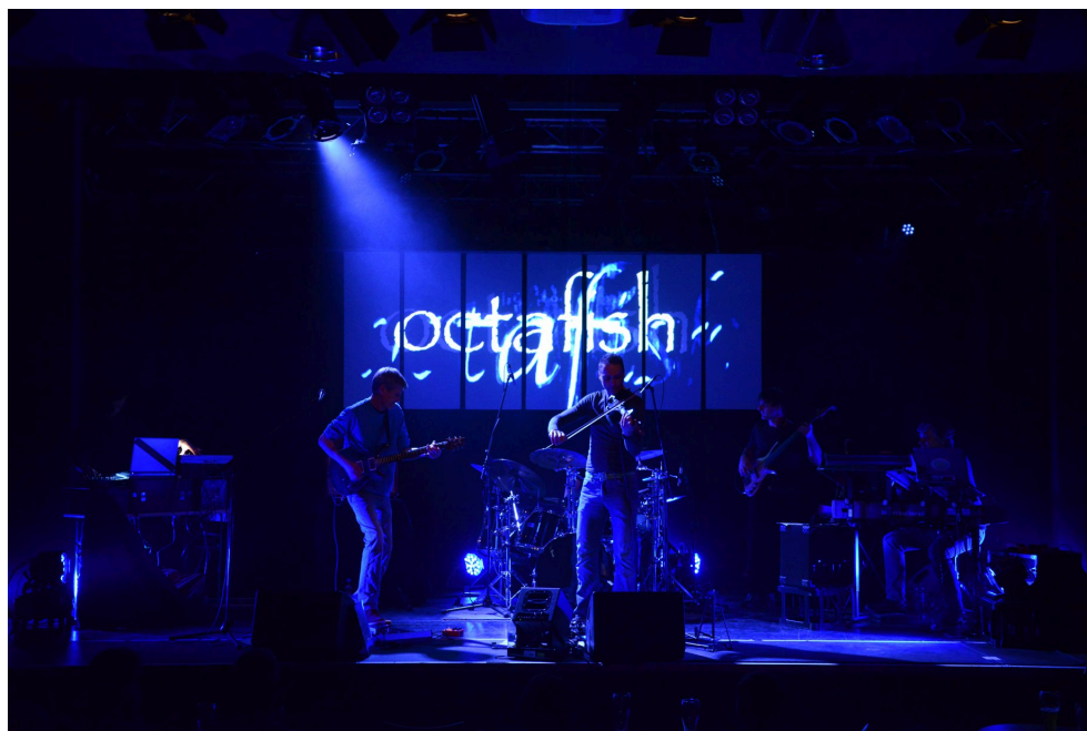
Octafish (Foto: Künstler)