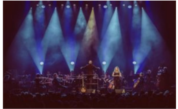
ANNEKE VAN GIERSBERGEN WITH RESIDENTIE ORKEST THE HAGUE SYMPHONIZED

Im Mai dieses Jahres kam es nun zu einer weiteren Zusammenarbeit mit klassischer Unterstützung, nämlich zwei Solokonzerte von Anneke van Giersbergen in Tilburg (013) und Den Haag (Paard), mit dem ebenfalls über einen hervorragenden Ruf verfügenden und seit 1904 bestehenden Residentie Orkest The Hague.