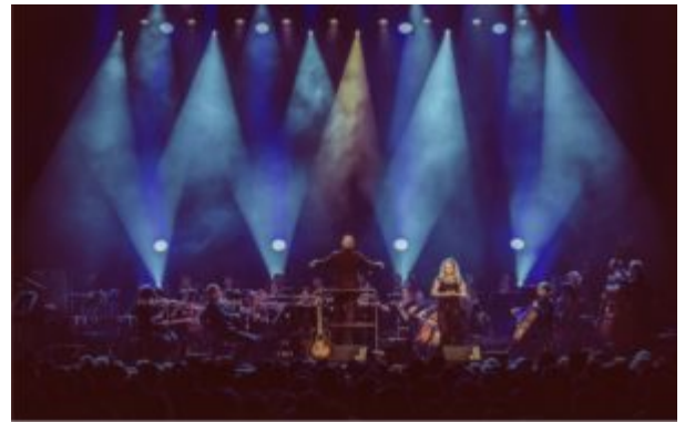
ANNEKE VAN GIERSBERGEN WITH RESIDENTIE ORKEST THE HAGUE SYMPHONIZED

Im Mai dieses Jahres kam es nun zu einer weiteren Zusammenarbeit mit klassischer Unterstützung, nämlich zwei Solokonzerte von Anneke van Giersbergen in Tilburg (013) und Den Haag (Paard), mit dem ebenfalls über einen hervorragenden Ruf verfügenden und seit 1904 bestehenden Residentie Orkest The Hague .