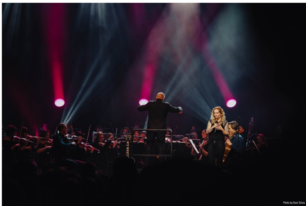
Anneke Van Giersbergen with Residentie Orkest The Hague