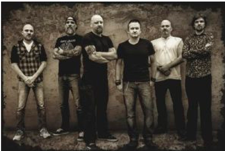
Nine Stones Close